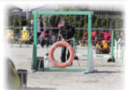
アジリティー施設