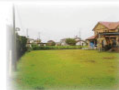
シュッツ・オビディエンス取組練習場